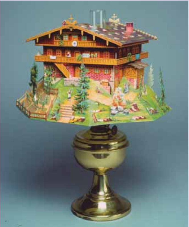
213/214 Lampenschirm Schweizerhaus, Lamp-shade Swisshouse, Zinkdruck, Doppelbogen 36 x 82 cm, J. F. Schreiber, Esslingen 1888.