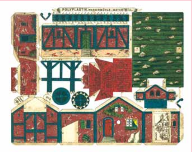
Polyplastik. Wassermühle. Mehrfarbenlithographie, geprägt, ausgestanzt mit gummierten Klebelaschen, Eduard Büttner & Co., Berlin 1878. Water-Mill, chromolithography, stamped, died with gummed hinges.

The research group „Arbeitskreis Geschichte des Kartonmodellbaus e.V.“ was founded in 2002 in Neuruppin (Germany) by a group of card modeling enthusiasts with a particular interest in historic card models. The stated aim of the group is to promote both research into the history of card modeling and the development of card modeling as an activity. We actively: engage in research into the economic and cultural aspects of card modeling - both present-day and historic; propagate the results of this research to the public through publications, exhibitions and participation in conventions; support a number of activities aimed at developing the interest of the younger generation in the craft of card modeling. Our principal undertakings are: