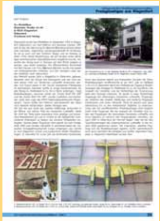
„Zur Geschichte des Kartonmodellbaus“ Heft 6. Umschlag und erste Seite des Artikels über die Firma GELI. Publication „Zur Geschichte des Kartonmodellbaus“ Heft 6. Jacket and first page of GELI article.