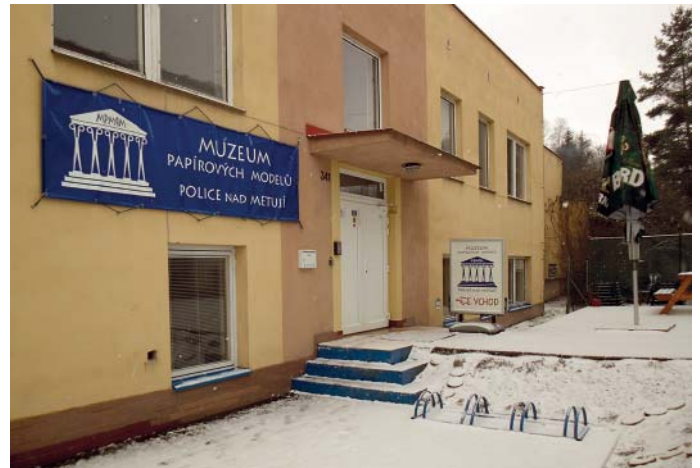
Das 2012 eröffnete Kartonmodellmuseum Police nad Metují [Poltitz an der Mettau] im Nordosten Tschechiens unweit der Grenze zu Polen.