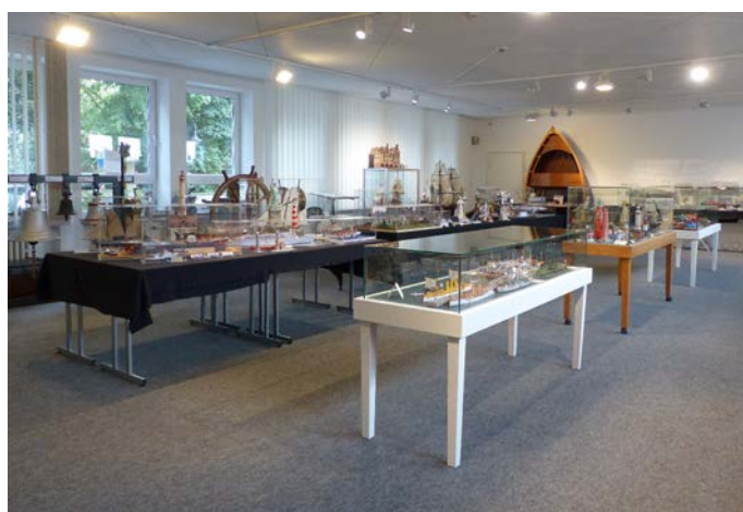
Blick in die Ausstellung „Alles Pappe?! – Kartonmodellbau gestern und heute – Emmerich 2019“ im Rheinmuseum Emmerich.