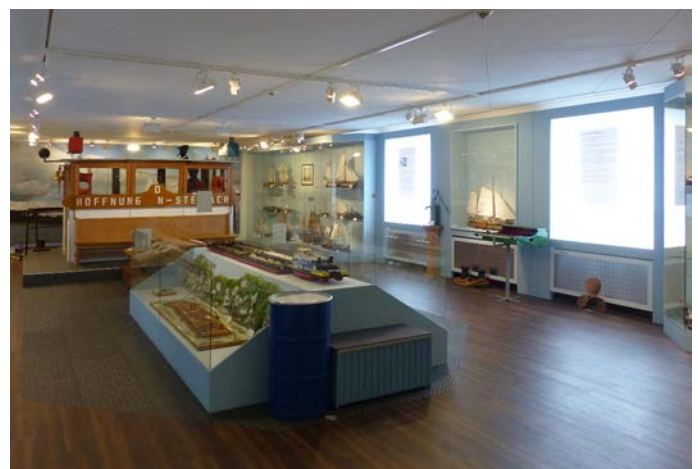
Rheinmuseum Emmerich im Kulturhaus am Martinskirchgang 2. Blick in die Dauerausstellung.