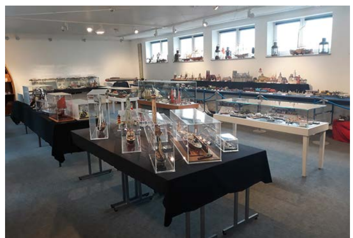
Blick in die Ausstellung „Alles Pappe?! – Kartonmodellbau gestern und heute – Emmerich 2019“ im Rheinmuseum Emmerich.