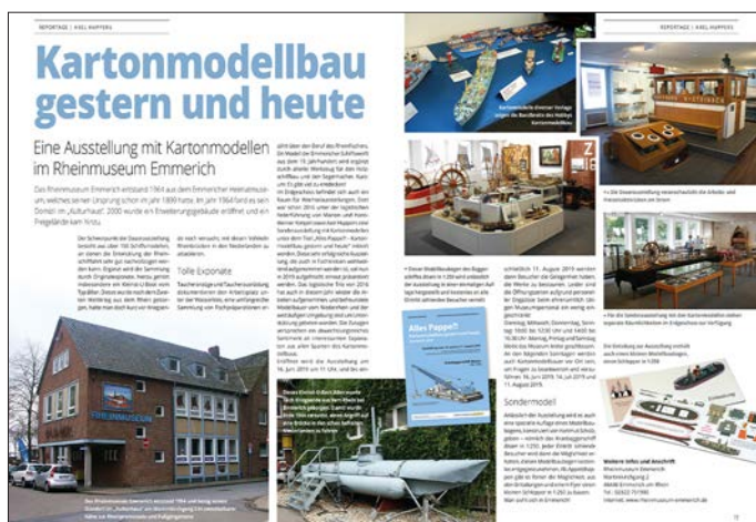
Axel Huppers: Kartonmodellbau gestern und heute. In: 4/2019 ModellWerft, Verlag für Technik und Handwerk (vth), Baden-Baden 2019, S. 18/19.

stützung. Waren 2016 „nur“ 16 Modellbauer an der Bestückung der Ausstellung beteiligt gewesen, konnten 2019 immerhin 24 aktive Teilnehmer gezählt werden, den Autor eingeschlossen. Auf Grund der 2016 gewonnenen Erfahrungen wurden 2019 dann jedoch bezüglich Werbung und Vorankündigung neue Wege beschritten. Es war festgestellt worden, dass Flyer und