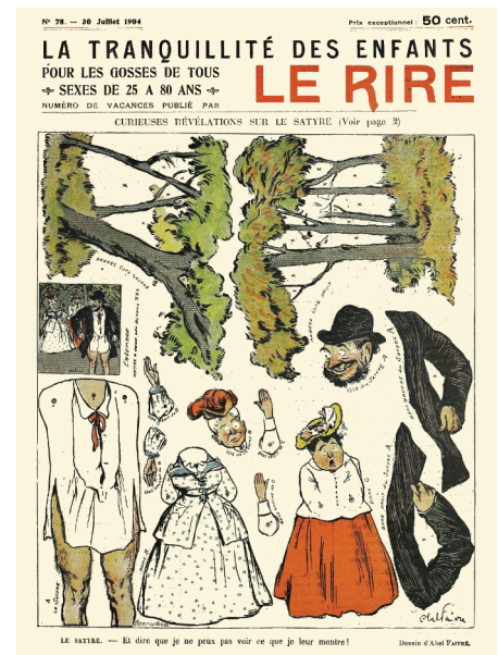
Le Rire, La Tranquillité des Enfants. Nr. 76, 30 Juli 1904. Umschlagseite 30,5 × 19,3 cm.

dar, die verschlossen sind wie das verschwiegene Lokal von Nevers, über welche man in letzter Zeit so viel spricht, und wo fleißige und hingebungsvolle Frauen in Gemeinschaft leben und kein anderes Ziel haben, als ehrbaren Bewohnern der Orte, in denen sie sich niedergelassen haben, ein bisschen unschuldige Ablenkung zu verschaffen. Obwohl sie ganz zurückgezogen leben, können wir sie nicht ganz den Jungfrauen in einem Kloster gleichstellen. Nicht nur, dass sie selten Jungfrauen sind; sie empfangen auch jeden, der eintritt. Sobald das Hausmädchen des Etablissements von unten ruft „Ein Herr kommt herauf!“, beeilen sich alle Damen, sich im Salon zu versammeln, wo sie den Ankömmling herzlich willkommen heißen. Man könnte auch sagen, sie empfangen ihn mit offenen Armen und beeilen sich, ihm ihre Talente zu zeigen. Sie legen kein Gelübde ab, jedenfalls keines über Keuschheit und Armut. Sie akzeptieren für die Ausübung ihres Kultes die kleinen Geschenke, die man ihnen gerne gibt, und falls nötig bitten sie auch darum. Andererseits verpflichten sie sich bei der Aufnahme in die Gemein-