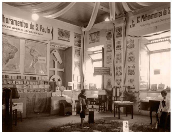
Ausstellungsraum der Companhia Melhoramentos de São Paulo anlässlich der Nationalen Buchausstellung 1931. Postkarte 1931.