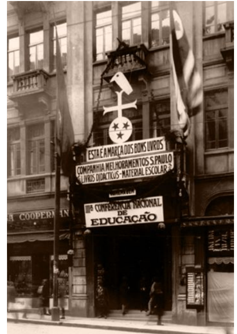
Links: Signet der Companhia Melhoramentos. Rechts: Fassade des Firmensitzes, geschmückt zu der III. Konferenz des Nationalen Erziehungswesens.