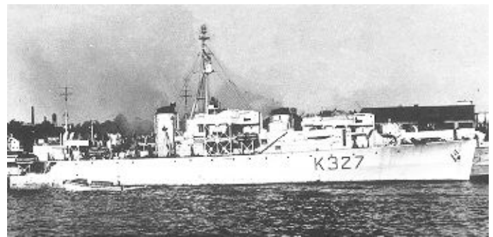
Die Fregatte „Stormont“ aus der „River-Klasse“ der kanadischen Marine, gebaut 1942/43 bei der Werft „Canadian Vickers“.