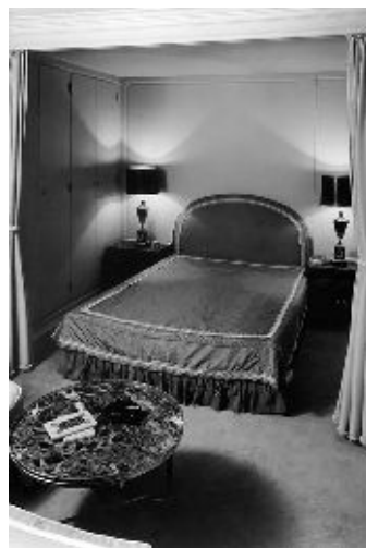
Ausstattung der „Christina“. Links: Das elegante Treppenhaus. Rechts: Eines der Gästeschlafzimmer.