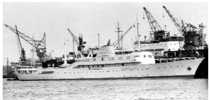
Aus der Fregatte „Stormont“ entstand durch Umbau bei der „Kieler Howaldtswerke AG, Kiel“, von Ende 1952 bis Mitte 1954 die Hochseejacht „Christina“.

an Bord den seinerzeitigen jugoslawischen Präsidenten Josip Broz Tito und den griechischen Ministerpräsidenten Konstantinos Karamanlis . Als die britische Königsfamilie an einer Kreuzfahrt teilnehmen wollte, Winston Churchill dies jedoch nicht wünschte, wurde diese ausgeladen. Jackie Kennedy erhielt 1963 erstmals eine Einladung, nachdem ihre Schwester Lee Radziwill sie Aristoteles Onassis vorgestellt hatte. Auf der Jacht wurden auch die Hochzeitsfeierlichkeiten von Grace Kelly und Rainier III. abgehalten. Fast jede Kabine hatte prominente Nutzer, darunter Maria Callas , Frank Sinatra , Richard Burton , Elizabeth Taylor , Greta Garbo , John Wayne , König Faruk von Ägypten , Aga Khan , Marilyn Monroe , John D. Rockefeller und J. Paul Getty . Die Jacht diente auch für geschäftliche Verhandlungen, bei denen wichtige Abschlüsse unterzeichnet wurden. Nach Aristoteles Onassis Tod schenkte seine Erbin Christina Onassis 4 1975 die Jacht dem griechischen Staat, der sie umbenannte und in den 1980er-Jahren als Staatsjacht „Argo“ ein-