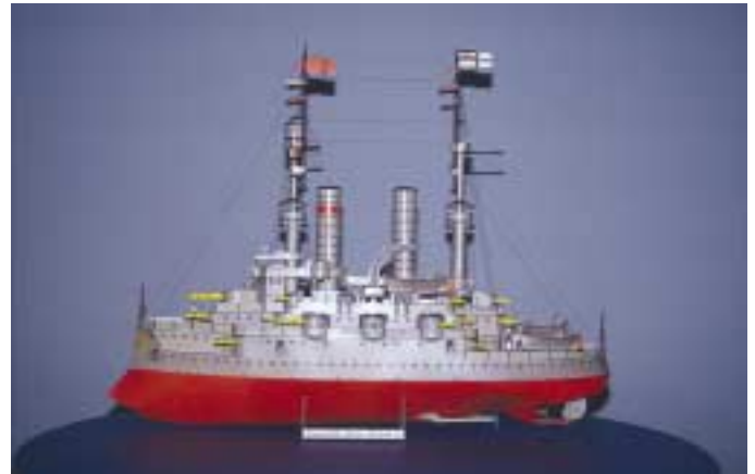
Nr. 509-513, Panzerschiff „Kaiser Wilhelm II“, J. F. Schreiber, Esslingen, 5 Bogen, 1931.

Das 19. und das 20. Jahrhundert waren Zeiten industriellen Auf- und Umbruchs. Die rasante technische Entwicklung, die Technikbegeisterung im ausgehenden 19. Jahrhundert bis weit in das 20. Jahrhundert fanden ihren Ausdruck auch in den „Modellierbogen“ des J. F. Schreiber-Verlags, die erstmals im Jahr 1878 erschienen. Bereits 1879 kommt mit der Nr. 22a ein Segelschiffmodell heraus, 1881 folgen die ersten Eisenbahnmotive (Nr. 158 ff.). Schon 1895 gibt es den ersten Straßenbahnwagen als Modell (Nr. 17). Das erste Automobilmodell folgt 1891 (Nr. 287), also fünf Jahre nach den Erfindungen von Karl Benz und Gottlieb Daimler. Aktuell waren auch die ersten Luftschiff- und Flugzeugmodelle, die vor 1910 herauskamen. Deutschlands Streben nach Weltmacht bezeugt das Riesenmodell des Vierschrauben-Schnelldampfers „Imperator“ auf 15 Bogen, das 1913 vor dem Ersten Weltkrieg erschien, der danach mit militärischen Modellen bis 1917 die Themen bestimmte. Nach dem verlorenen Krieg und nach der Inflation erschienen ab 1925 wieder Flugzeug-, Eisenbahn-, Luftschiff- und Automobilmodelle. Ein Prospekt aus dem Jahr 1932 zeigt auf dem Titelblatt den Schienenzeppelin (Nr. 344/45). Das ramponierte Selbstwertgefühl der Deutschen konnte sich an technologischen Leistungen aufrichten. Die Aufrüstung des Reiches ab 1933 wird begleitet von Militärflugzeug- und Marine-