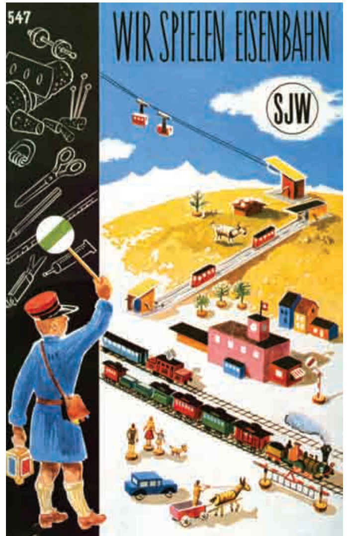
547 „Wir spielen Eisenbahn“, Vierfarben-Buchdruck, 21 x 13,5 cm. Umschlag. Let's play railway, four-colour letterpress, 21 x 13,5 cm. Jacket.

„Meine eigene SBB“ [Meine eigene Schweizerische Bundesbahn] erschien 1950 und ist das erste Heft mit Modellbaucharakter. Im Vorwort dazu sind unter anderem folgende Anforderungen und Anleitungen zu lesen: „Lasse dir einmal erzählen, was du mit diesem Heftchen anfangen kannst. Zuerst lies einmal ganz genau, was an Beschreibungen und Anleitungen drin steht! Bist du ein richtiger Bastler, der Freude an einer Modelleisenbahn hat, so holst du dir ein stumpfes Messer aus der Küche!! Rasch die Farbstifte oder den Malkasten, Leim oder Kleister zur Hand. Mit etwas Geduld wirst du ein schönes Spielzeug bauen. Viel Vergnügen!“. Auf sieben Doppelseiten sind eine elektrische Lokomotive Typ Re 4/4, ein Gepäck- und ein Personenwagen sowie ein kleiner Bahnhof, ein Tunnel, eine Eisenbahnbrücke, Signale und ein Postauto als Konstruktionserlebnis enthalten. In einem anderen Heft, „Wir