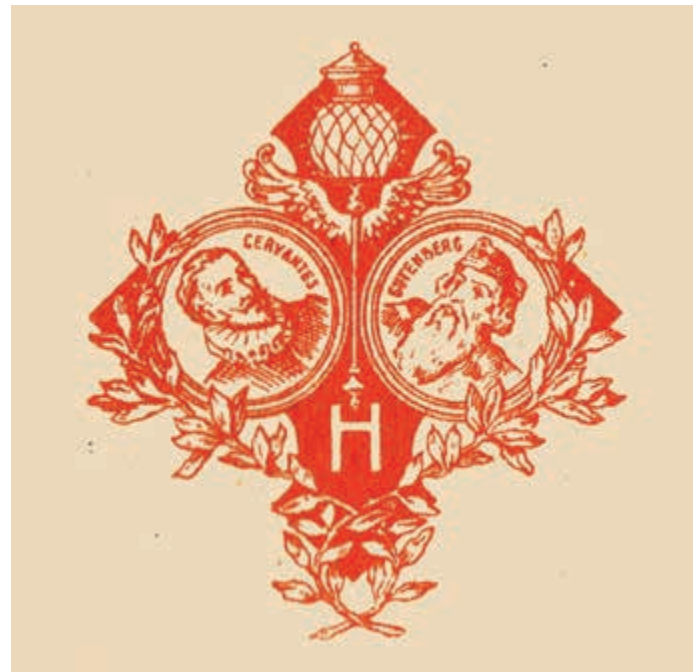
Das Logo der Editorial Hernando S.A. mit den Portraits von Cervantes und Gutenberg wurde ab 1924 verwendet.